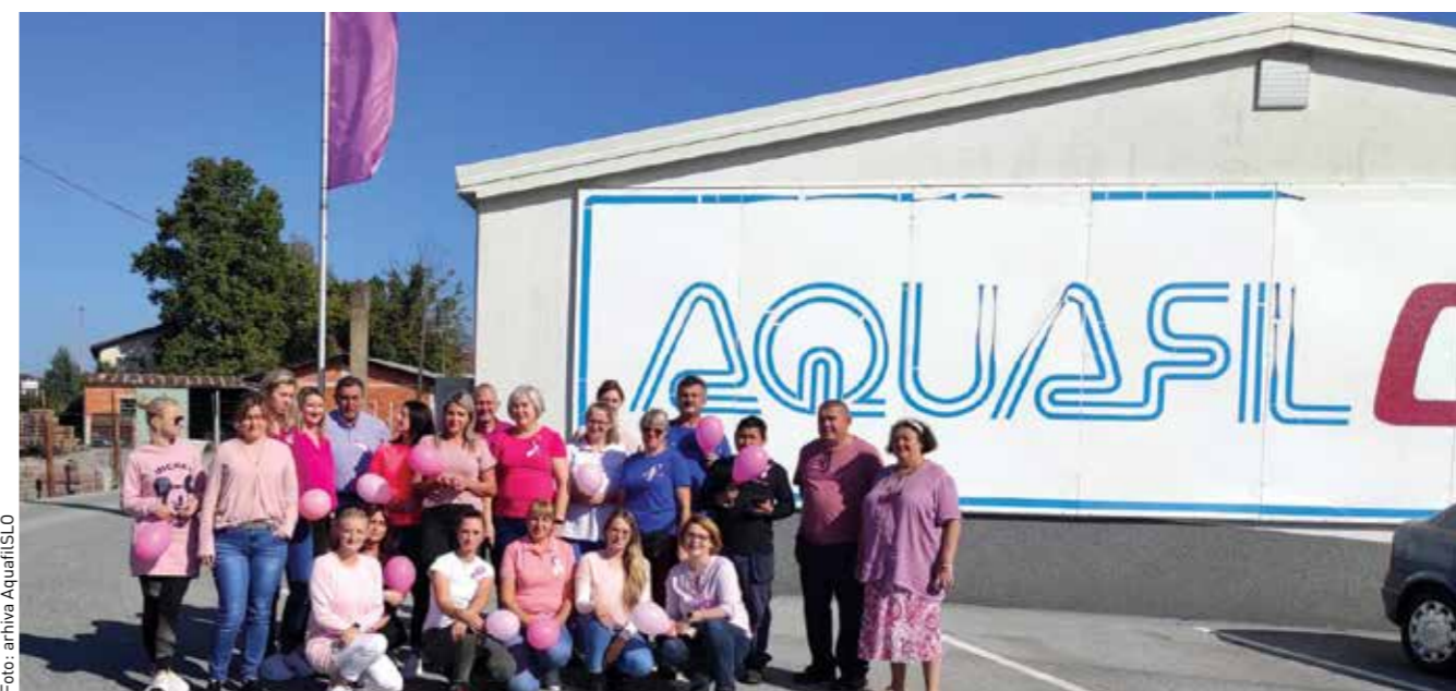
Djelatnici AquafilCRO u humanitarnoj akciji "Ružičasti mjesec u Krapinsko-zagorskoj županiji".

Briga o zaposlenima, treći stup trajne strategije, ima postavljene prioritete ciljeve, kao što su omogućavanje sigurnog radnog okoliša, podrška osobnom i profesionalnom razvoju zaposlenika te poštovanje ljudskih prava na radnom mjestu. Djeluju u skladu sa sustavima upravljanja sigurnošću na radu prema ISO 45001 i osiguranja ljudskih prava i prava radnika prema SA 8000, te provode projekt upravljanja talentima. U AquafilCRO