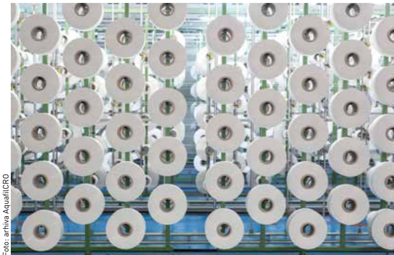
ECONYL® regenerirana najlonska vlakna.

omogućavaju i besplatno dopunsko zdravstveno osiguranje, sistemske preglede i preventivne preglede za rano otkrivanje raka zaposlenicima. "U AquafilCRO vjerujemo da su zaposlenici ključna komponenta našeg poslovanja; oni su ključni za sve uspjehe tvrtke. AquafilCRO brine o svojim zaposlenicima i njihovom zdravlju", objašnjava predsjednik uprave AquafilCRO, dr. Saša Muminović.