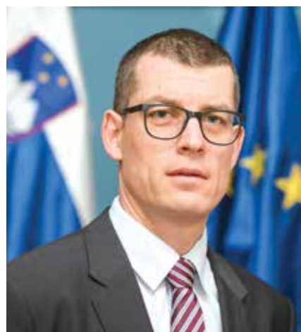
Gašper Dovžan, Veleposlanik Republike Slovenije u Zagrebu

Zajedničko članstvo u EU pridonijelo je iznimnom ojačanju gospodarske suradnje, a posljedično i podizanju standarda stanovnika. Opseg međusobne robne razmjene prije ulaska Hrvatske u EU, prije deset godina, iznosio je samo dobre 2,3 mlrd eura, a sada se popeo na 7,3 mlrd eura. Ako tome pridodamo još