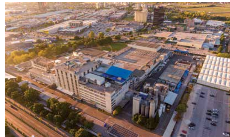
Tvornica AquafilSLO u Ljubljani.

Aquafil Grupa napravila je važan korak povezan s vrijednosnim lancima. U četvrtom stupu trajne strategije Aquafila stoji da surađuju s dobavljačima i kupcima kako bi potaknuli promjene i okolišnu održivost u cijeloj industriji. Stoga od prošle godine u procesu odabira dobavljača zahtijevaju od svakog novog dobavljača suglasnost s Aquafilovim Etičkim kodeksom i Politikom društvene odgovornosti i ljudskih prava. "Kod kupaca prije svega tražimo dugo-